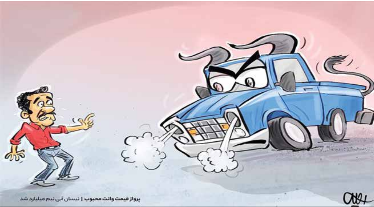
پرواز قیمت وانت محبوب | نسیان آبی نیم میلیارد شد